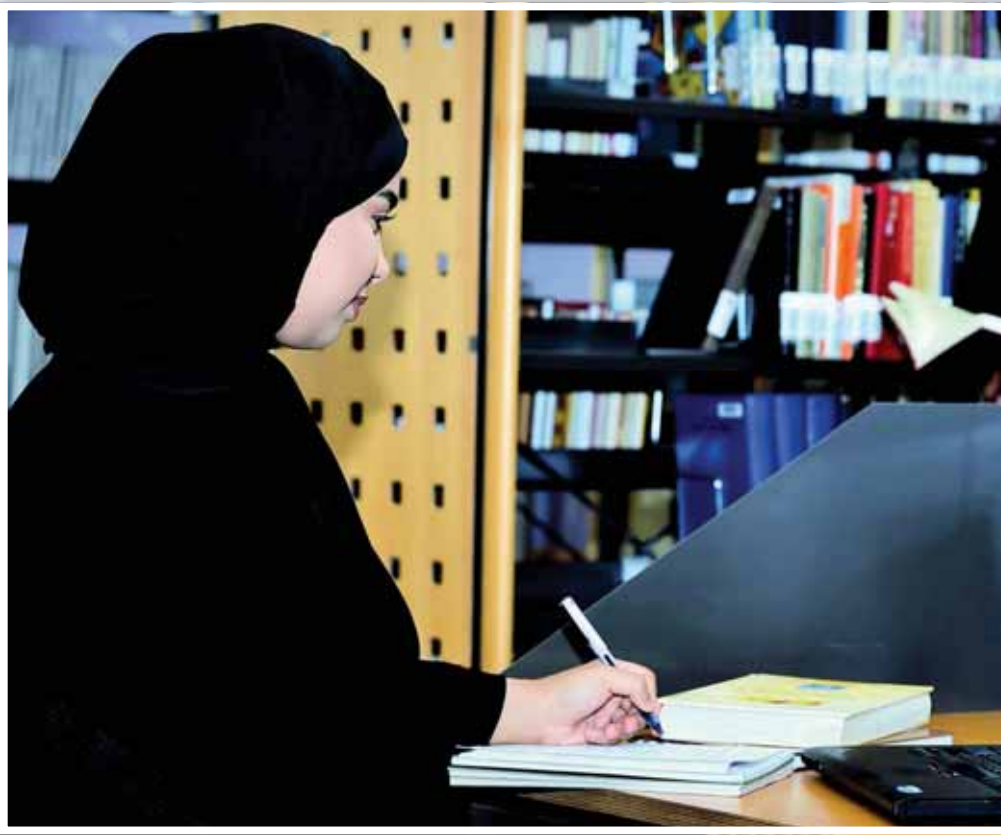
خلال جمع البيانات المسحية

نسعى لبناء القدرات داخل الجامعة في استخدام منهجية البحوث المسحية